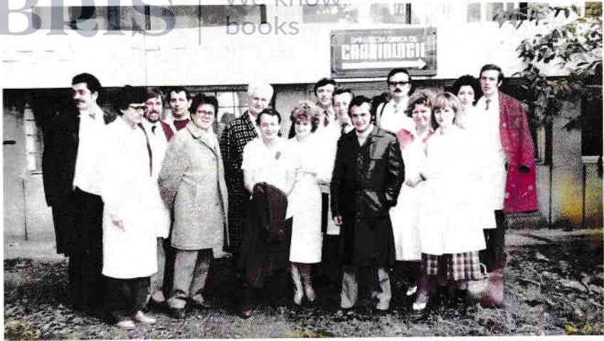
Profesorul alături de cursanți, 1985