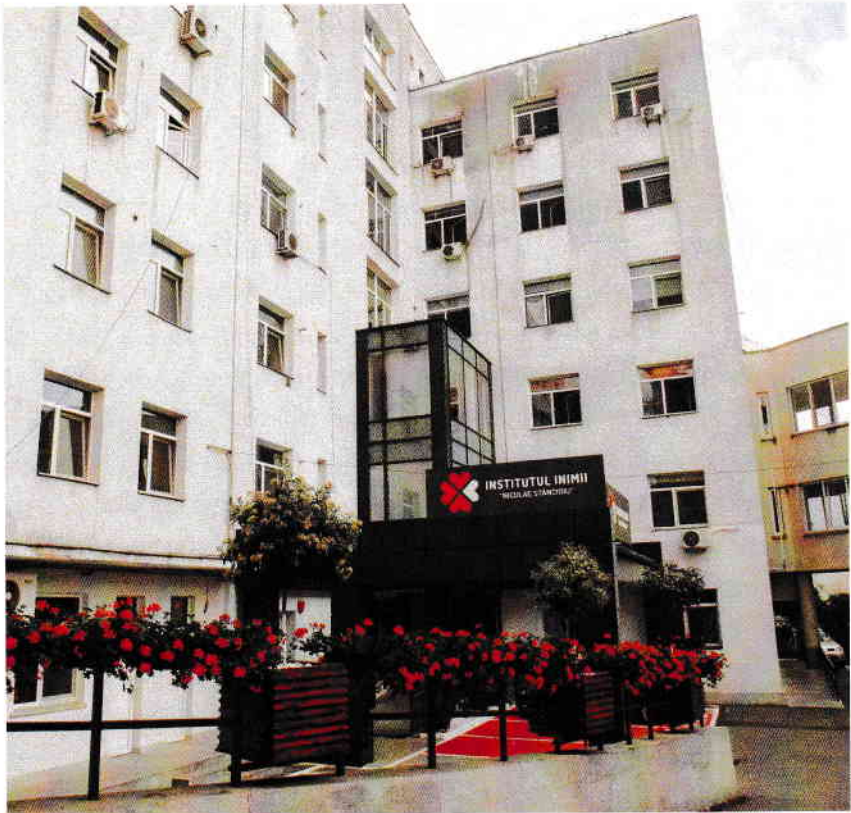
Clinica de Cardiologie a Institutului Inimii, Cluj-Napoca